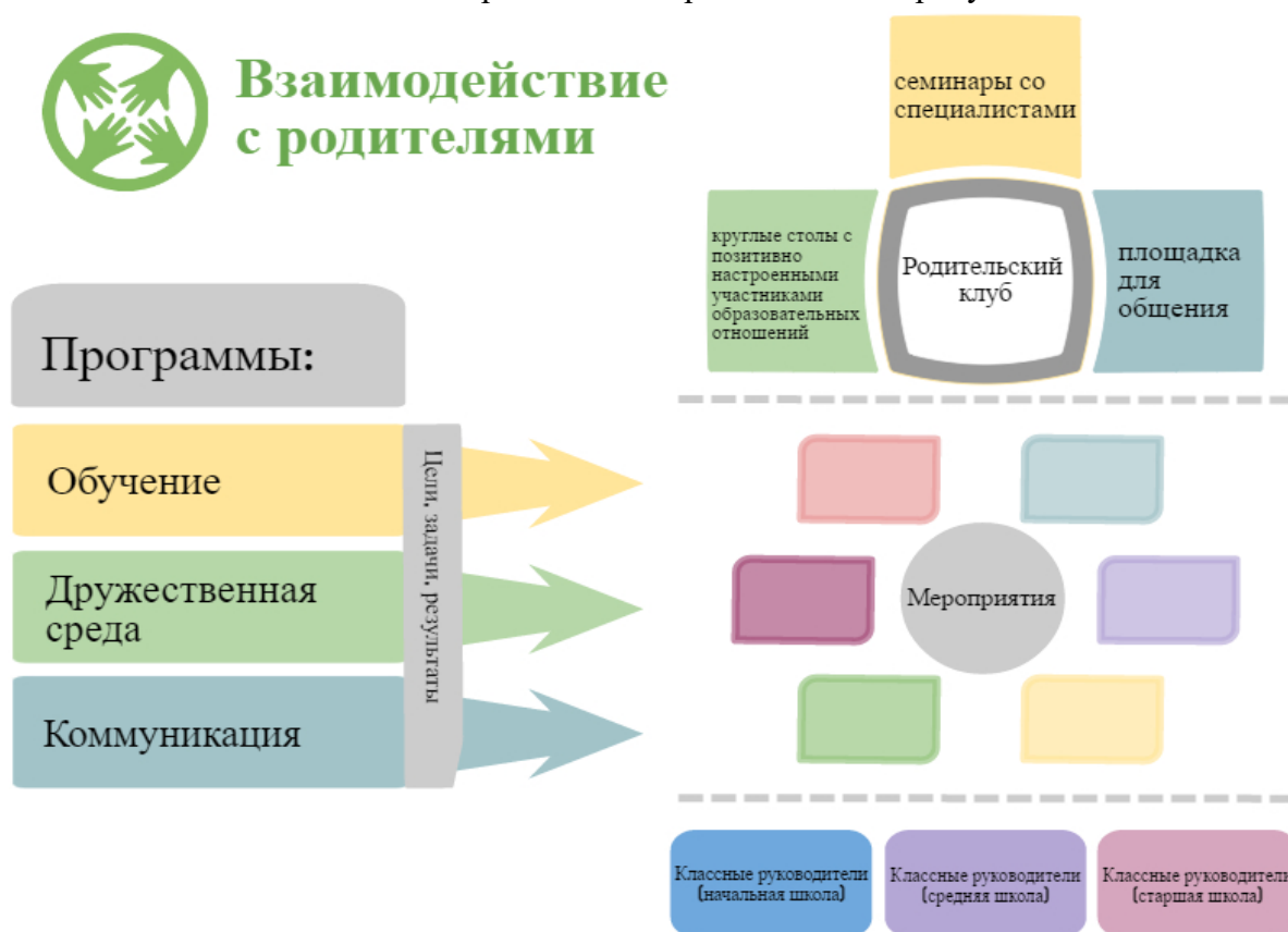
Рисунок 2 — Направления взаимодействия с родительским сообществом

Модель взаимодействия с родителями представлена на рисунке 2.